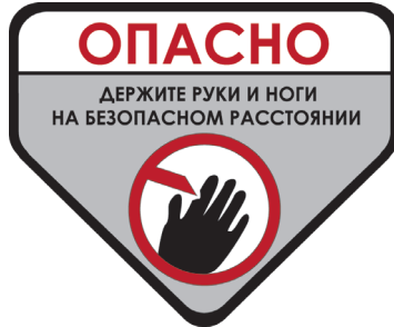
Рис.2: На газонокосилке найдите наклейку безопасности: «Держите руки и ноги на безопасном расстоянии».

В8 – Во время работы обязательно используйте защитные очки и наушники для Вашей безопасности.