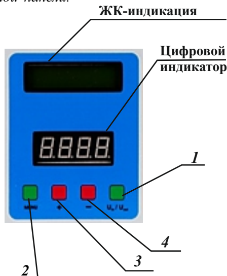
Рисунок 8. Информационная панель

В таблице 8 описаны режимы измерений и цифровой индикации нормализатора. В таблице 9 описаны сервисные сообщения (ЖК-индикация и речевые оповещения). Опционо нормализаторы FLAGMAN (по индивидуальному заказу) могут содержать речевой информатор дублирующий текстовые сообщения ЖК-индикации. В аварийных режимах нормализатора речевые оповещения включаются автоматически и повторяются 3 раза. Если необходимо прослушать информацию дополнительно, речевое оповещение активируется при нажатии любой кнопки информационной панели.