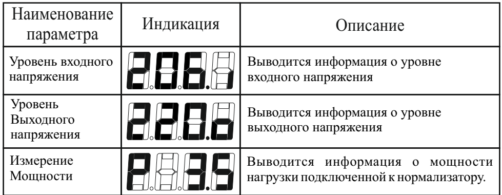
Таблица 3 Режимы измерений и индикации

После включения нормализатора, цифровое табло отображает входное напряжение. Значок <I> в правом нижнем углу указывает на измерение входного напряжения.