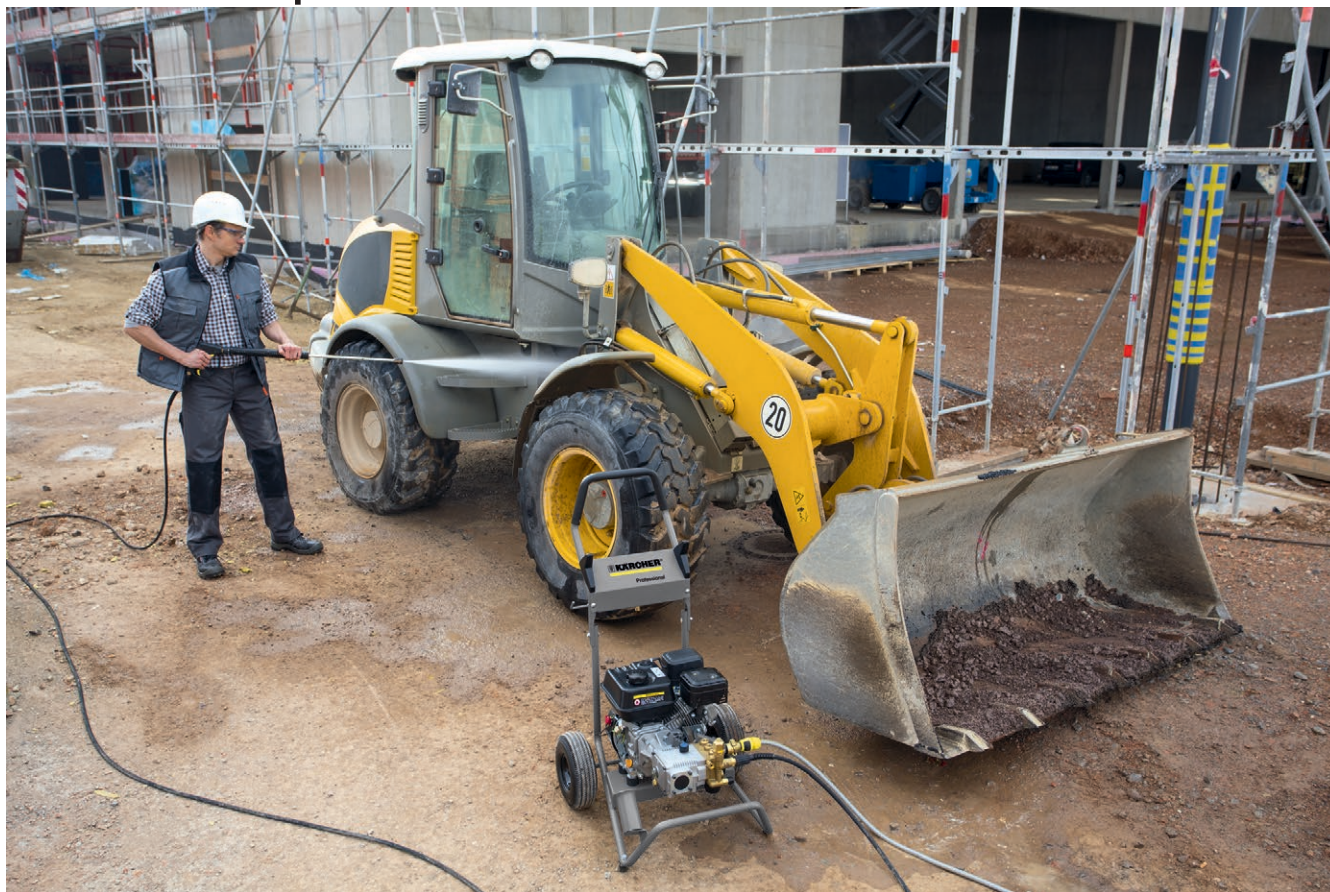
HD 6/15 G Classic