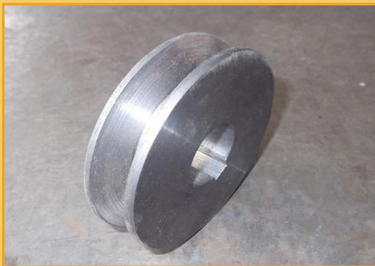
Литой чугунный шкив – дешево, но недолговечно