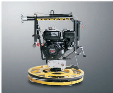
Складная ручка для удобства транспортировки и хранения.