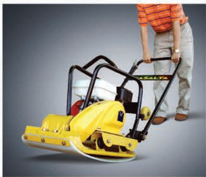
Полиуретановый ковер также входит в комплект поставки.