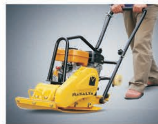
Ковер для укладки клинкерной плитки.