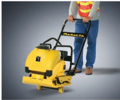
Транспортировочные колеса входят в комплект поставки.

В конструкции этой машины применены новейшие разработки в области эргономики и универсальности. Одновременно мощная и компактная, кроме стандартных видов работ MSR90 может укладывать плитку, горячий и холодный асфальт. Полиуретановый ковер и система орошения входят в комплект поставки.