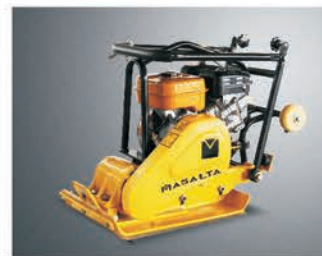
Складная ручка для удобства транспортировки и хранения.