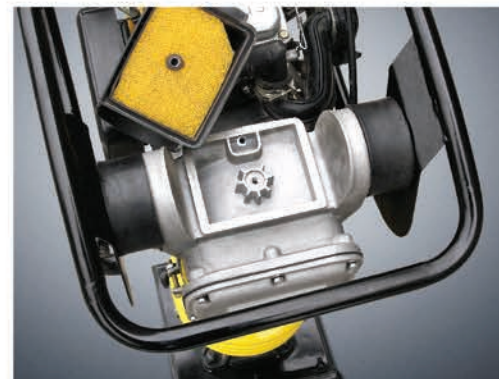
Дополнительная система очистки воздуха