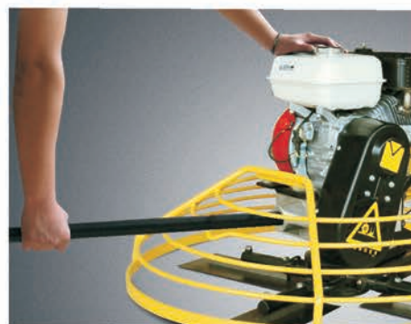
Труба для переноски.