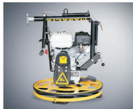
Складная ручка для удобства транспортировки и хранения.