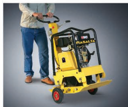
Транспортировочные колеса входят в комплект поставки.