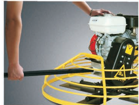
Труба для переноски.