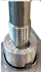
Рисунок 3 – Установка направляющего стержня в сборе с фрезой на поверхность седла клапана

Направляющий стержень в сборе с фрезой цилиндрической поверхностью стержня установить в направляющую втулку клапана, устанавливая в положение, когда режущие кромки ножей достигнут обрабатываемой поверхности седла клапана (рисунок 3).