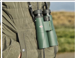
Einfach mitzunehmen: Ergonomisch geformtes, leichtes Gehäuse.

Basierend auf über 60 Jahren Erfahrung an Entwicklung und Produktion von hochwertigen Optiken, hat Kowa diese modernen und bezahlbaren Ferngläser der SV II-Serie auf den Markt gebracht.