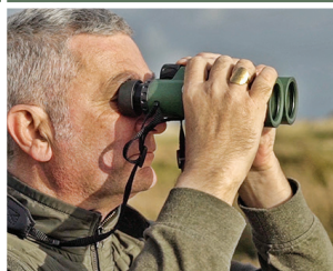
Einfach hell und klar: Voll mehrfach vergütete Optik.