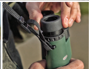
Einfach einzustellen: Perfekt an Ihre Sehbedürfnisse anpassbar.