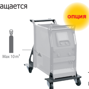
Тележка ref. 040960

Режим Easy или режим PRO для полного доступа к выбору параметров.