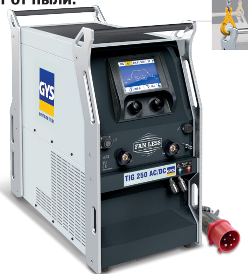
Аппарат поставляется без аксессуаров.