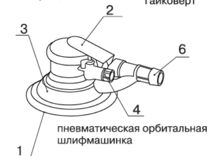
пневматическая орбитальная шлифмашинка