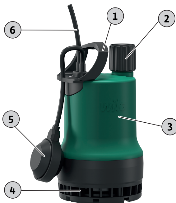
Fig. 1: Огляд

Занурювальний насос для стаціонарної та пересувної зануреної установки. Насос із вбудованим поплавковим вимикачем для повністю автоматичної експлуатації.