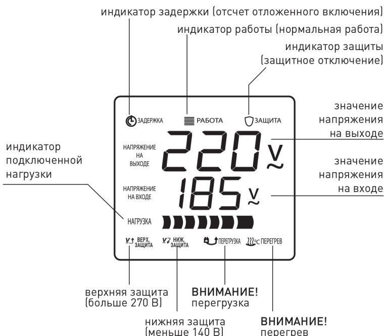
Индикация режимов работы стабилизатора.

При нормальной работе стабилизатора на индикаторе отображается режим «РАБОТА», величины выходного и входного напряжения и индикатор «НАГРУЗКА», по которому можно судить о загруженности прибора.