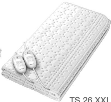
TS 26 XXL