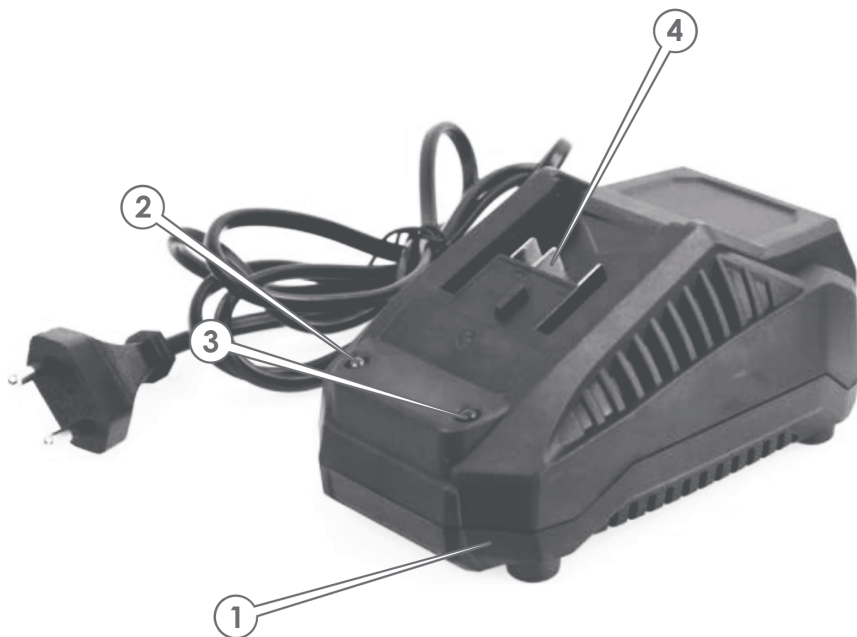
«LSL 1845 SmartLine+», «LSL 1824 SmartLine+»