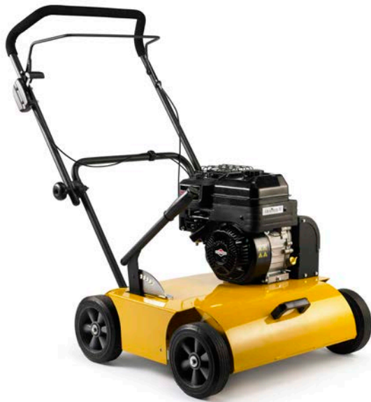
Figur / Figure / Abbildung / ilustracja