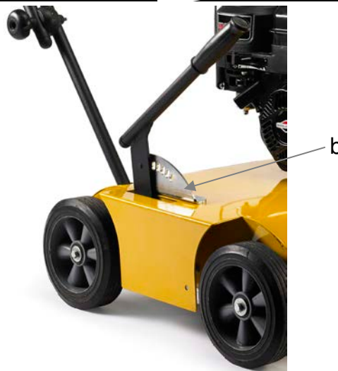
Figur / Figure / Abbildung / ilustracja