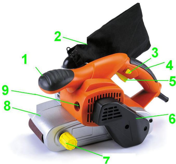
Fig 1 Side view of the machine