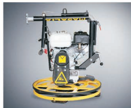
Складная ручка для удобства транспортировки и хранения.