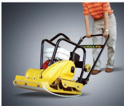
Полиуретановый ковер также входит в комплект поставки.