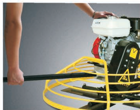
Труба для переноски.