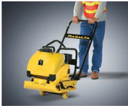
Транспортировочные колеса входят в комплект поставки.

В конструкции этой машины применены новейшие разработки в области эргономики и универсальности. Одновременно мощная и компактная, кроме стандартных видов работ MSR90 может укладывать плитку, горячий и холодный асфальт. Полиуретановый ковер и система орошения входят в комплект поставки.