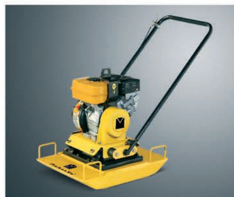
4 удобных ручки для транспортировки