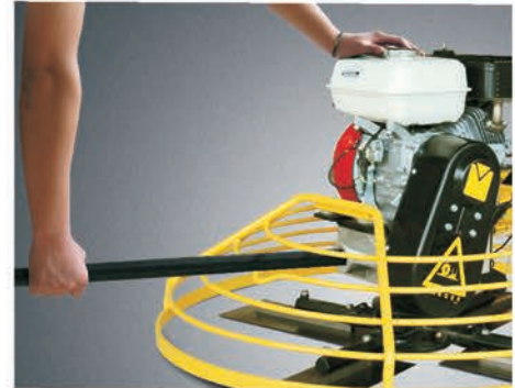
Труба для переноски.