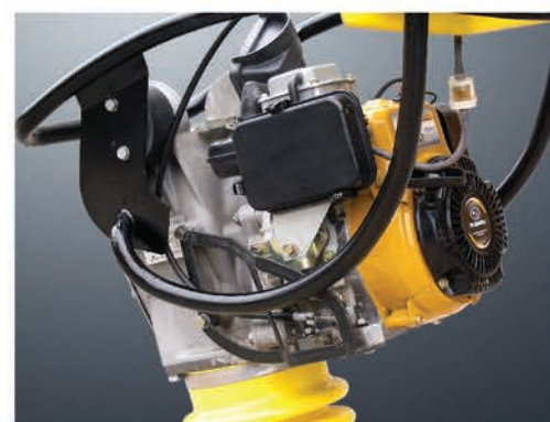
Специальная защитная рама для двигателя