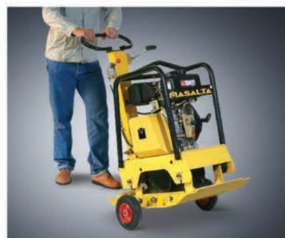
Транспортировочные колеса входят в комплект поставки.