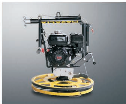
Складная ручка для удобства транспортировки и хранения.