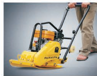
Ковер для укладки клинкерной плитки.