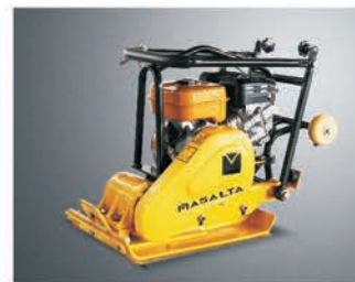
Складная ручка для удобства транспортировки и хранения.