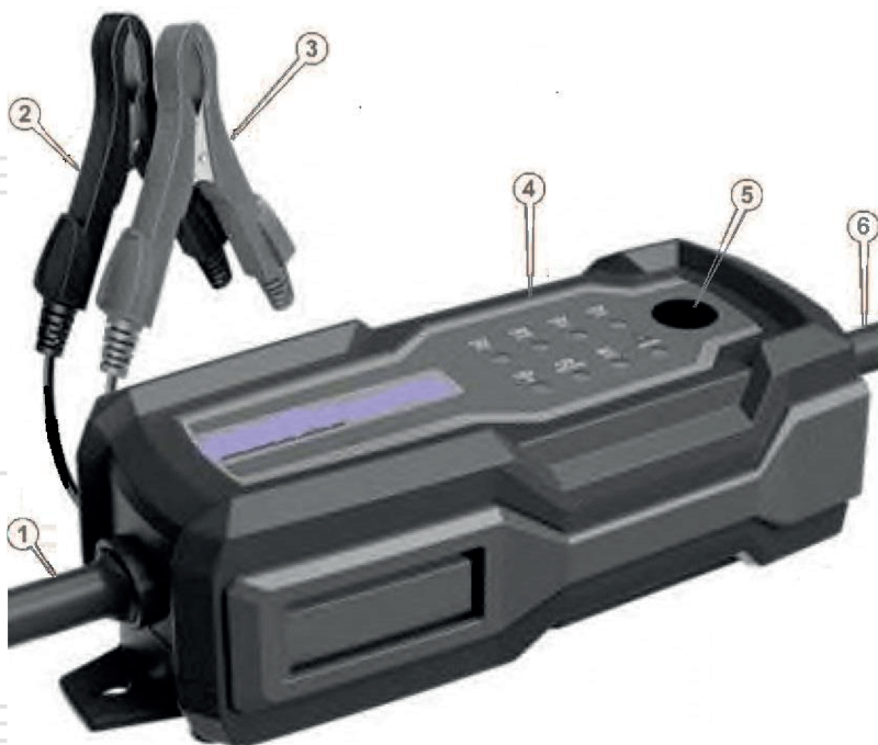
Рисунок 1. Основні елементи будови виробу