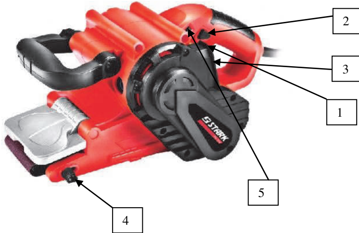
Фото 1 Загальний вид стрічкової шліфувальної машини